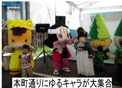
本町通りにゆるキャラが大集合

4月19日から始まった「花と緑のぐんまづくり」は、ハンギングバスケットづくりなどの体験教室、ぐんまちゃん、小松姫、お富ちゃんなど県内のゆるキャラが大集合したり、プロスポーツ選手との交流などが、3日～6日におこなわれ、多くの人を楽しみました。