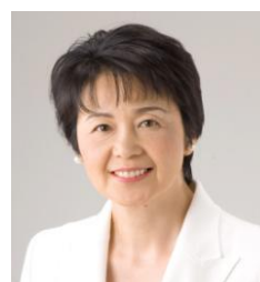
紙 智子参議院議員

無料 生活法律相談のお知らせ 弁護士が遺産相続、交通事故サラ金などの相談におたえします 日時 一月八日・二十一日 午後一時から 場所 日本共産党利根沼田地区委員会事務所 沼田市下久屋町九八三 電話三一一五一九 ※相談を希望される方は、前日までにご連絡ください