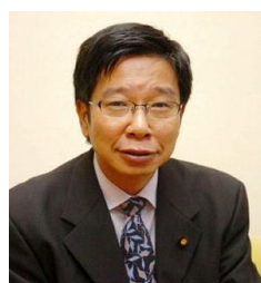
大門みぎし参議院議員