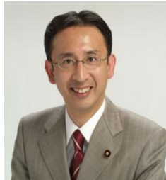
塩川鉄也衆議院議員