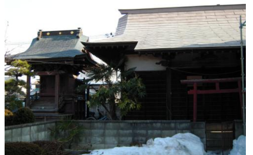
稲荷様と清正公社殿

日蓮聖人が佐渡へ流される時に、この地で一夜を過ごしたことから、一人の僧が弘安年間（1278～1287）に一字を創建し本隆寺と称したのが妙光寺のはじまりと伝えられています。