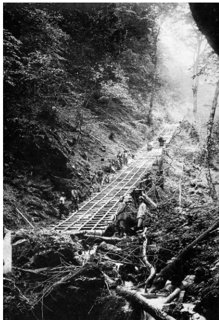
土橋の巻き下げ装置