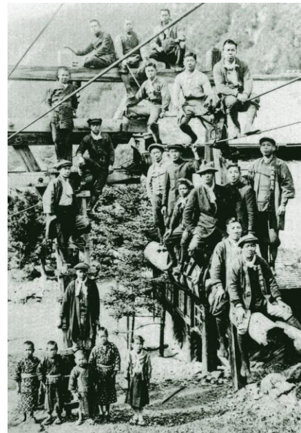
鉄索夫一同(大正14年)