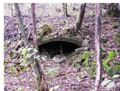
砥沢に残る室の跡