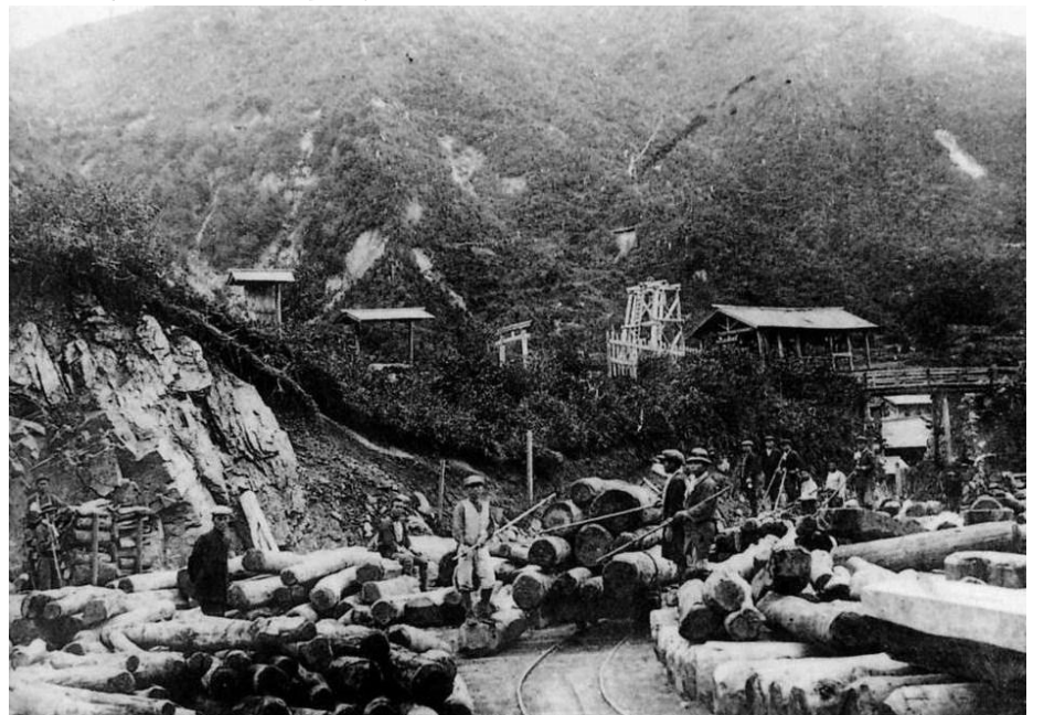
大正初期のころの山神神社横の土場