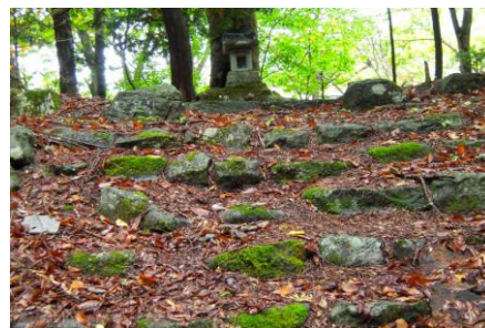
現在の山神神社(砥沢)