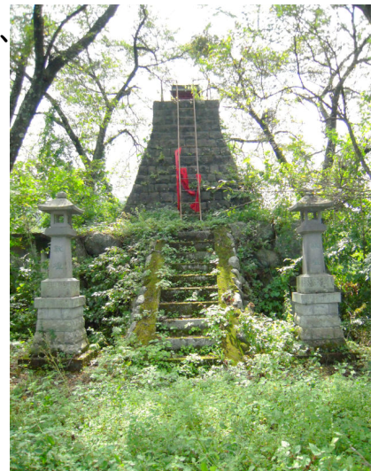
ダム湖の傍らに建つ天狗宮

日清・日露、第2次世界大戦などの戦争の時には、武運長久を祈願する出征兵士や家族が多くおとずれたともいわれ、ダム建設で湖底に沈むことになったため、現在の場所に移されました。