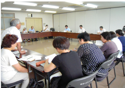
社会保障推進協議会がおこなった対市交渉

利根沼田社会保障推進協議会は18日、国民健康保険と介護保険について沼田市と懇談をこない、病院の窓口3割負担の軽減などを要請しました。