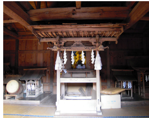
大楊の二荒山神社

観音様は、金子美濃守をはじめとする、金子一族が崇拝してきたと伝えられており、大平（おおたいら）観音堂には金子一族の墓といわれる墓石があります。