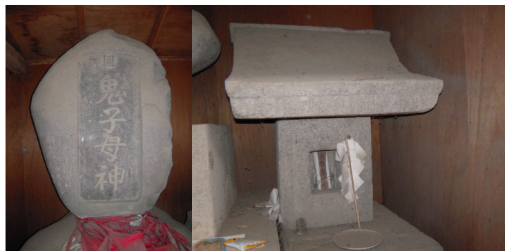
鬼子母神石塔(左)と賽の神石宮(右)

こうした鬼子母神の石塔は、旧沼田市内や白沢町ではみられない石塔といわれています。