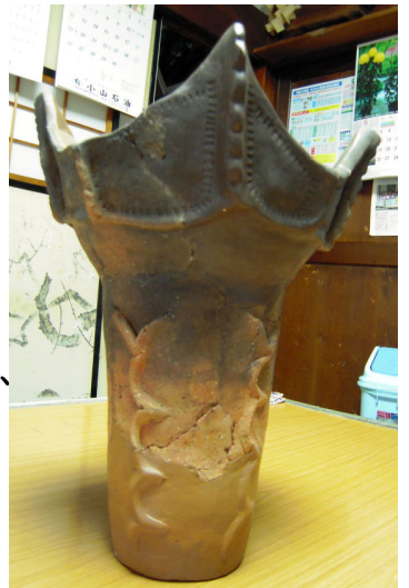
復元された縄文土器

森山にある行人堂には、片品村花咲の2人が奉納した鬼子母神と彫られた石塔がありますが、なぜ鬼子母神の石塔が奉納されたのかは不明です。