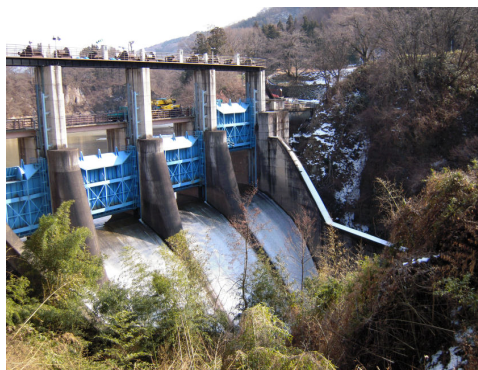
園原ダム、尾合発電所とつながる平出ダム

平出ダムは、昭和39年（1964）に完成し、堤高40m、堤頂長87mあり、ダムの下にある利南発電所で発電しています。（最大出力5,300KW）