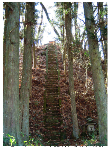
石段の上に石宮と祠がある薬師堂跡

今の石宮はコンクリートで補修されており、昔の面影を残していると思われるのは、屋根と台石の部分だけです。薬師堂の眼下を流れる片品川は、薬師淵とよばれ、白沢の勝景地の一つといわれています。