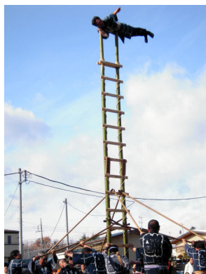
披露されたはしご乗り

沼田市消防団出初め式が9日、沼田小学校屋内運動場でおこなわれ、市内パレードの後、市役所駐車場ではしご乗りが披露されました。