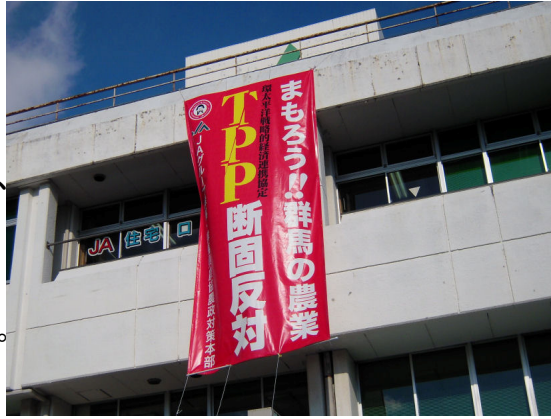
JA利根沼田本所にかかげられたTPP反対の垂れ幕