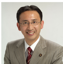
塩川つや衆議院議員