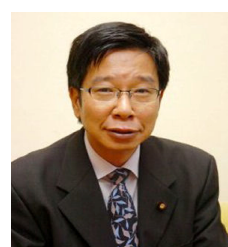
大門みき参議院議員