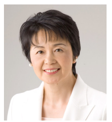
紙 智子参議院議員