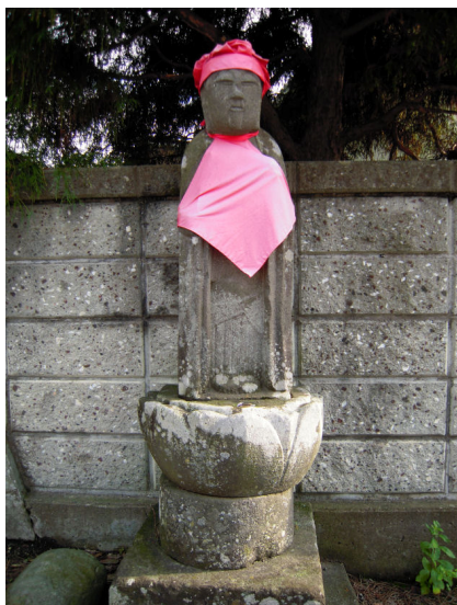
防火將軍地蔵とよばれている北向き地蔵

万延元年（1860）に村中あげて火災を防ぐことを願って造られたといわれ、「火防勝軍地蔵」とよばれています。