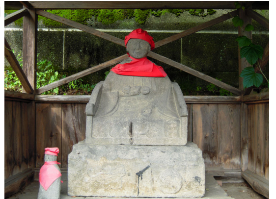
弘法清水の弘法様

白沢町は、古語父や高平を中心に、古くから修験道に深く関係していたといわれていますが、観音寺にも以前は、「役小角」の像があり、修験道