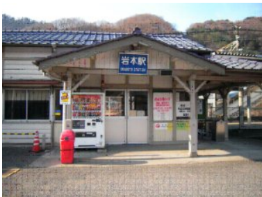
建て替えがおこなわれるJR岩本駅 駅舎です。