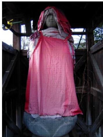
茂左衛門にかかわると言われている状橋地蔵

そこで里の人たちが茂左衛門の死を悲しみ、地蔵を建てたと言われますが、施主、発願人は不明です。