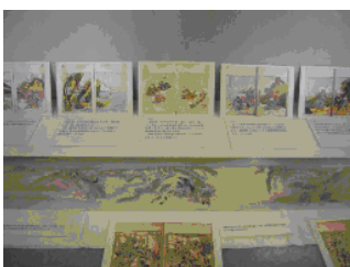
展示されている絵巻物など

白沢公民館で、群馬県立土屋文明記念文学館巡回展として、「桃太郎はどこへ行く」が開かれています。