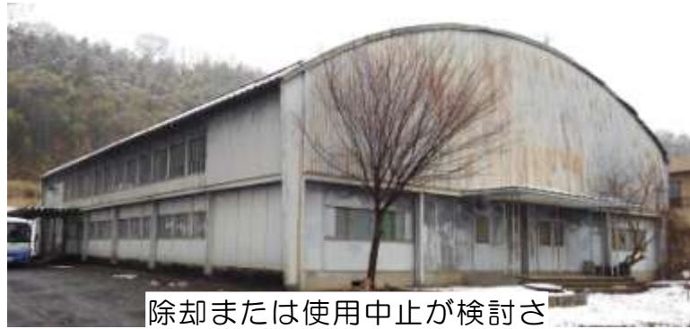
除却または使用中止が検討されている旧利南中屋内運動場

沼田市は、「沼田市公共施設等総合管理計画」で、市全体の公共施設とインフラ（道路・橋など）の老朽化度などを調査、施設ごとに廃止・存続・建替などの方針を決めています。