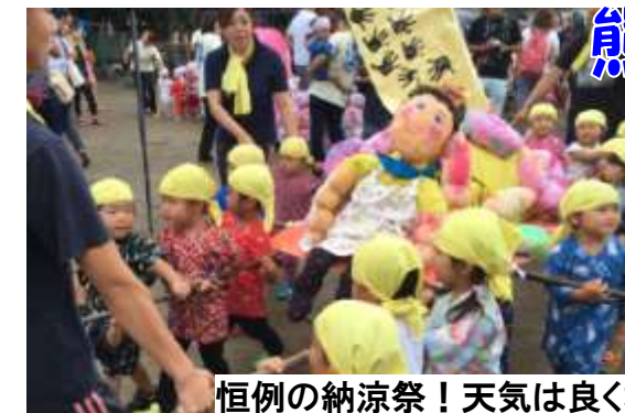
恒例の納涼祭! 天気は良くなかったけどがんばった子供たち