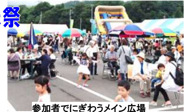
参加者でにぎわうメイン広場