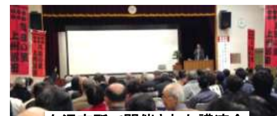
白沢支所で開催された講演会