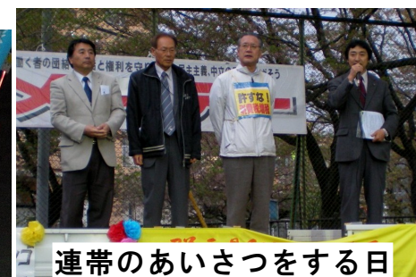
連帯のあいさつをする日 本共産党利根沼田議員団