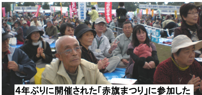
4年ぶりに開催された「赤旗まつり」に参加した 北部・西部・薄根合同後援会のみなさん