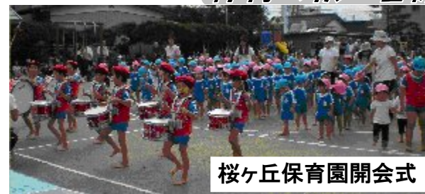
桜ヶ丘保育園開会式